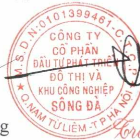
Trần Việt Dũng